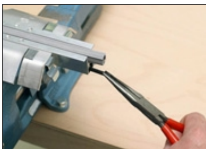
10 Gewindestift herausziehen.