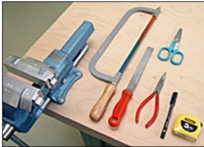
1 Werkzeug bereitstellen, max. Kürzbarkeit siehe Etikett