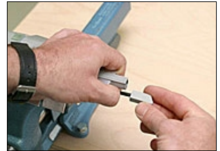
3 Dichtung einspannen, Auslösefalle auf der Kürzungsseite herausziehen und abschrauben