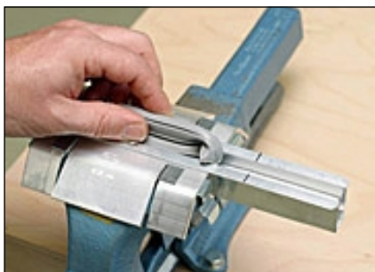
4 Dichtprofil bis hinter der Schnitt- stelle aus der Halteschiene ziehen