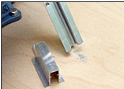
7 Späne entfernen