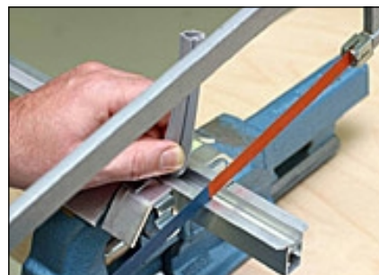
5 Mit einer Metallsäge kürzen