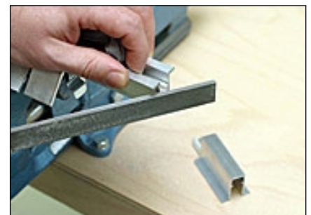
6 Schnittstelle entgraten