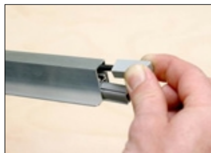
11 Auslösefalle wieder aufschrauben, Dichtung auf Funktion prüfen