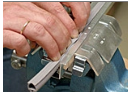
8 Dichtprofil wieder in die Halteschiene drücken