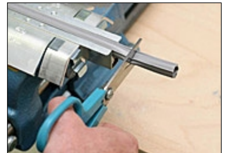
9 Dichtprofil mit Überstand abschneiden